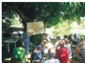
Em Buritizal, vivenciar para aprender

Tirar os alunos da sala de aula significa dar uma oportunidade diferente de aprendizado. Fazer do lazer o aprendizado dá uma nova visão daquilo que se vê em sala de aula. Duas fazendas em Buritizal foram palco do programa neste primeiro semestre.