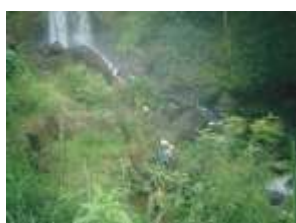
Estudar o relevo e observar as formações rochosas é uma experiência única

Vivenciar significa ver, viver, conviver, aprender na prática e levar para a vida. Pensando nisso, o Lacordaire promove todo ano os Estudos Vivenciais que consistem no aprendizado fora da sala de aula, com o intuito de mostrar para os alunos a importância de saber as disciplinas e como aplicar cada uma dentro da sociedade.