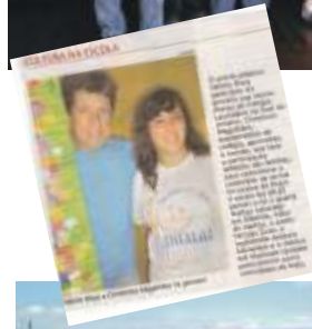
A festa foi destaque também nos jornais locais, como o A Cidade