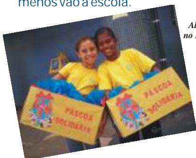
Alunas entregaram no HC os chocolates arrecadados na escola

Essas crianças e adolescentes, vindos de famílias pobres, são obrigados a trabalhar para ajudar no sustento da família. Elas não podem se dar ao luxo de ganhar um presente caro e, na maioria dos casos, presente algum. Muitas delas freqüentam a escola à noite, por trabalharem durante o dia, e não têm condições de estudar, pois o trabalho exige muita energia. Outras, nem ao menos vão à escola.