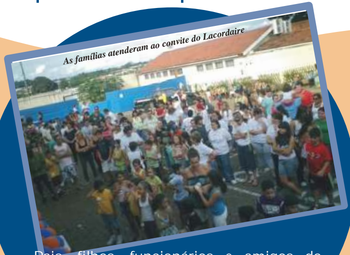
As famílias atenderam ao convite do Lacordaire

Pais, filhos, funcionários e amigos do Lacordaire participaram de momentos de lazer no colégio; a prática é aprovada por especialistas. Página 6