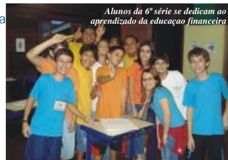
Alunos da 6ª série se dedicam ao aprendizado da educação financeira