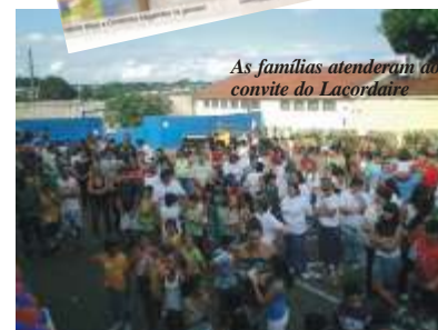
As famílias atenderam do convite do Lacordaire