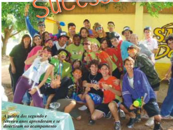
A galera dos segundo e terceiro anos aprenderam e se divertiram no acampamento