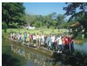
Alegria da turma em um dia de viver e aprender